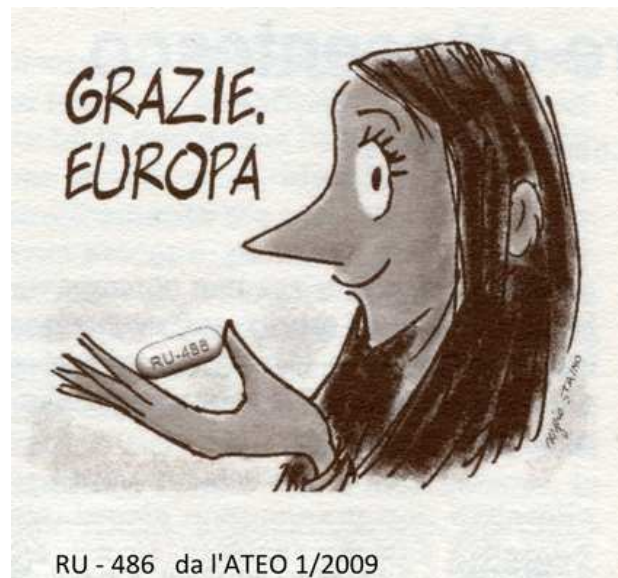
RU - 486 da l'ATEO 1/2009

No, all'ipocrisia: milioni di persone non seguono più di fatto le disposizioni religiose in fatto di contraccezione, convivenza, interruzione di gravidanza, continenza, matrimonio, divorzio, omosessualità, e, francamente è veramente difficile nascondere tutto ciò dietro una foglia di fico!